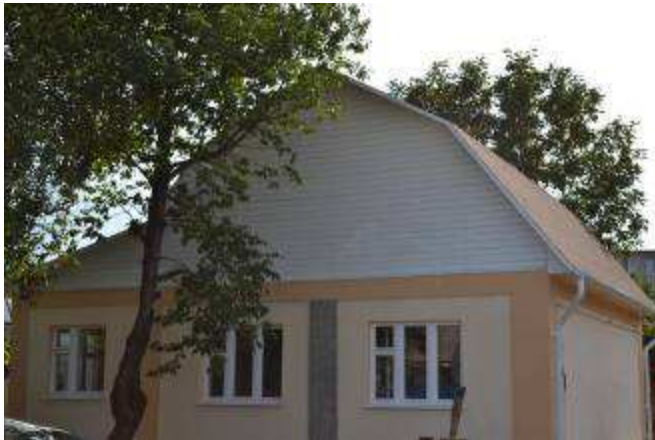
Дом молодежи открыт в августе 2011 г.

Цель проекта: Повышение социальной компетентности выпускника детского дома посредством практического формирования жизненно-значимых социальных навыков в процессе самостоятельного проживания в социальной квартире.