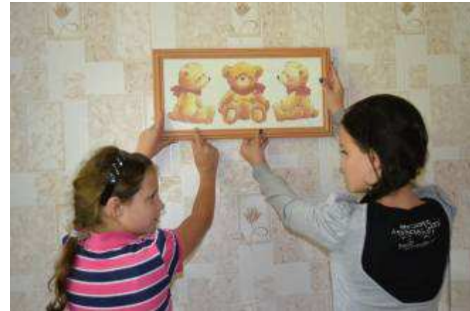
Мы сделаем Дом уютным!