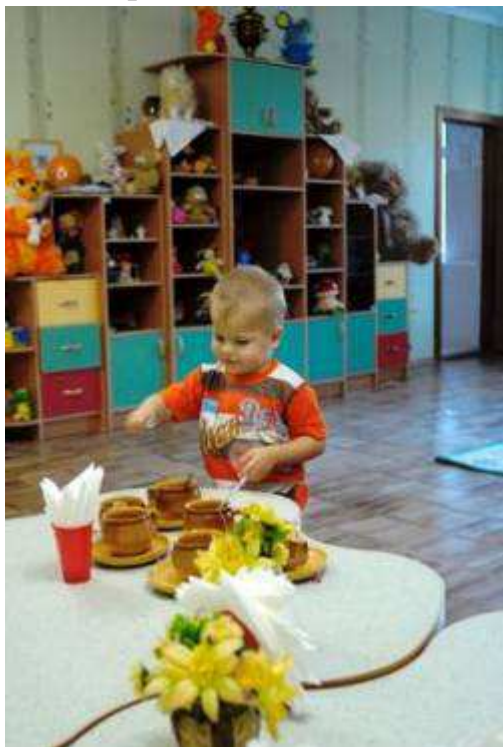
К самостоятельной жизни готовимся с ранних лет