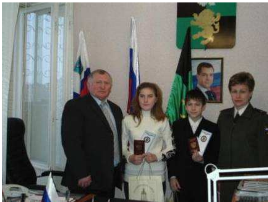
Самостоятельно получение паспорта РФ - важный этап становления гражданина