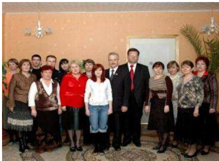
Заседание Совета по решению перспективных проблем выпускников

В состав Совета включены педагоги детского дома, работники социального, юридического отделов, службы экономической безопасности корпорации ЖБК-1. Основные вопросы: содействие при решении жилищных вопросов, оформлении различных документов, оказание помощи в трудоустройстве, помощь выпускницам, имеющим малолетних детей, содействие в лечении. Помощь оказывается как материальная, так и консультативная.