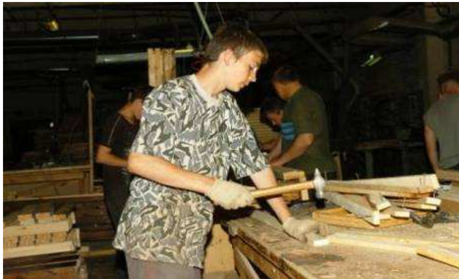
Производственная практика по профессии «плотник»