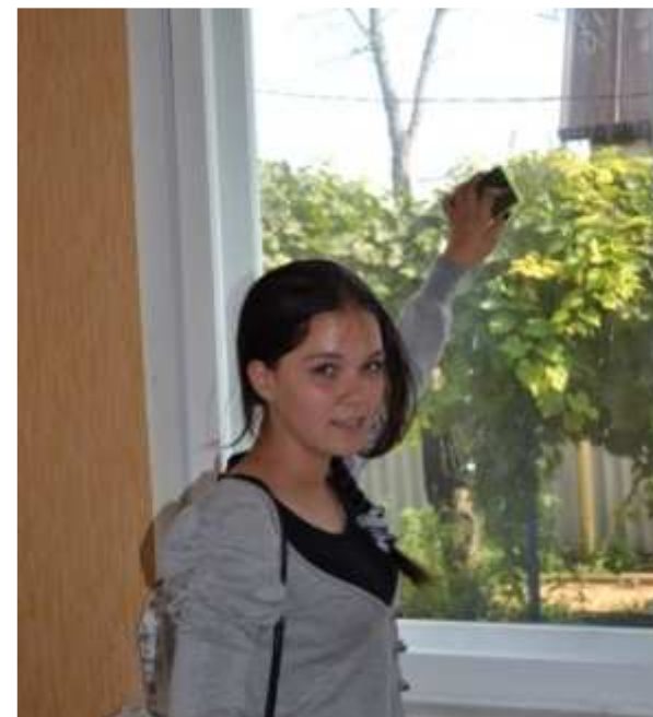
Дом молодежи обустроиваем сами!