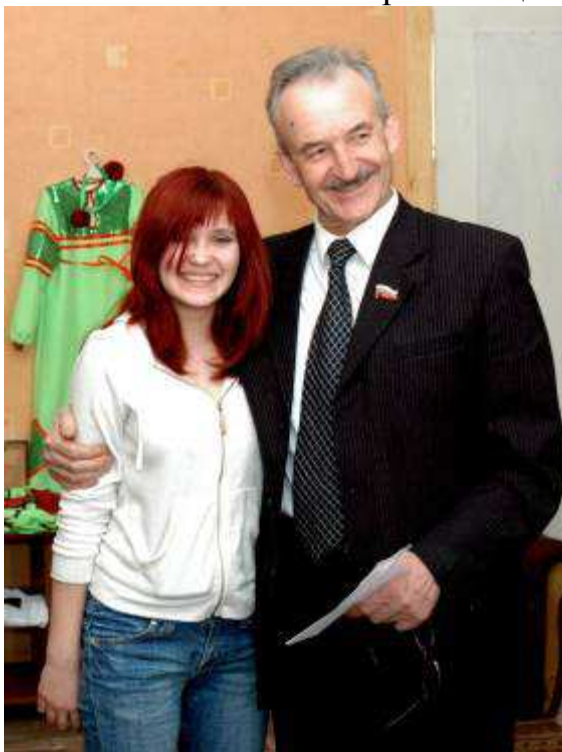
Судьба выпускников – под пристальным вниманием учредителя детского дома