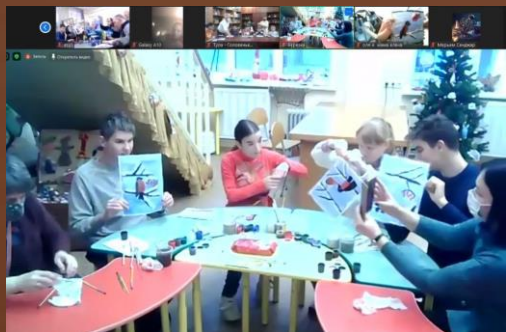
Проект «Эстафета возможностей» (Президентские гранты 2020).