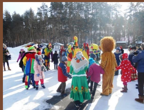
Проект «Дети вместе» (Президентские гранты 2016).