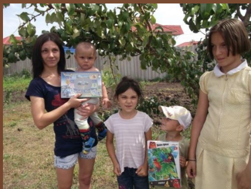
Проект «Солнечный круг» (Православная инициатива, 2015).